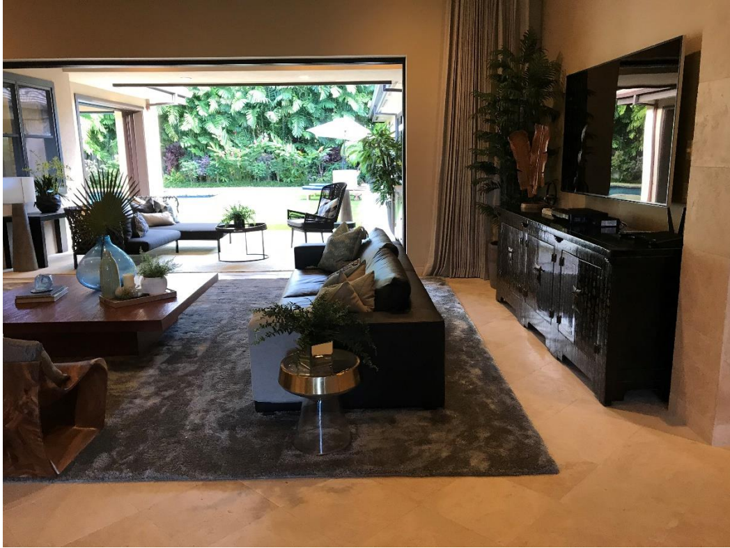
リビングから庭を一望できる