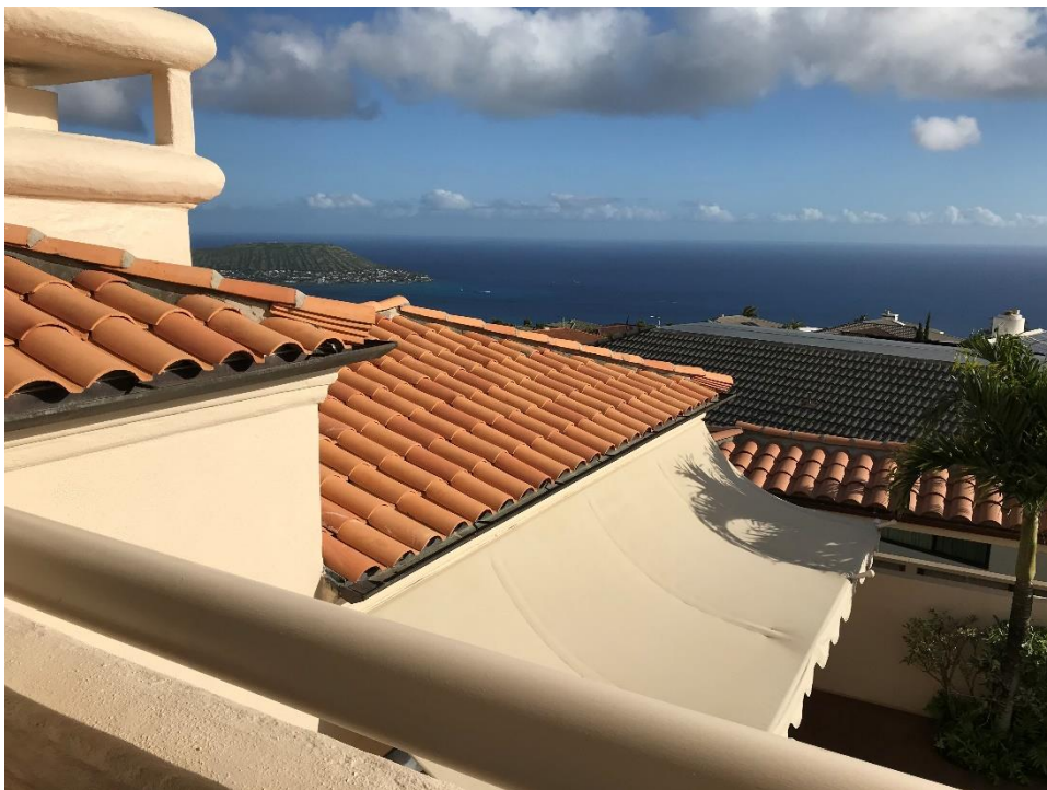
海が一望できるテラス