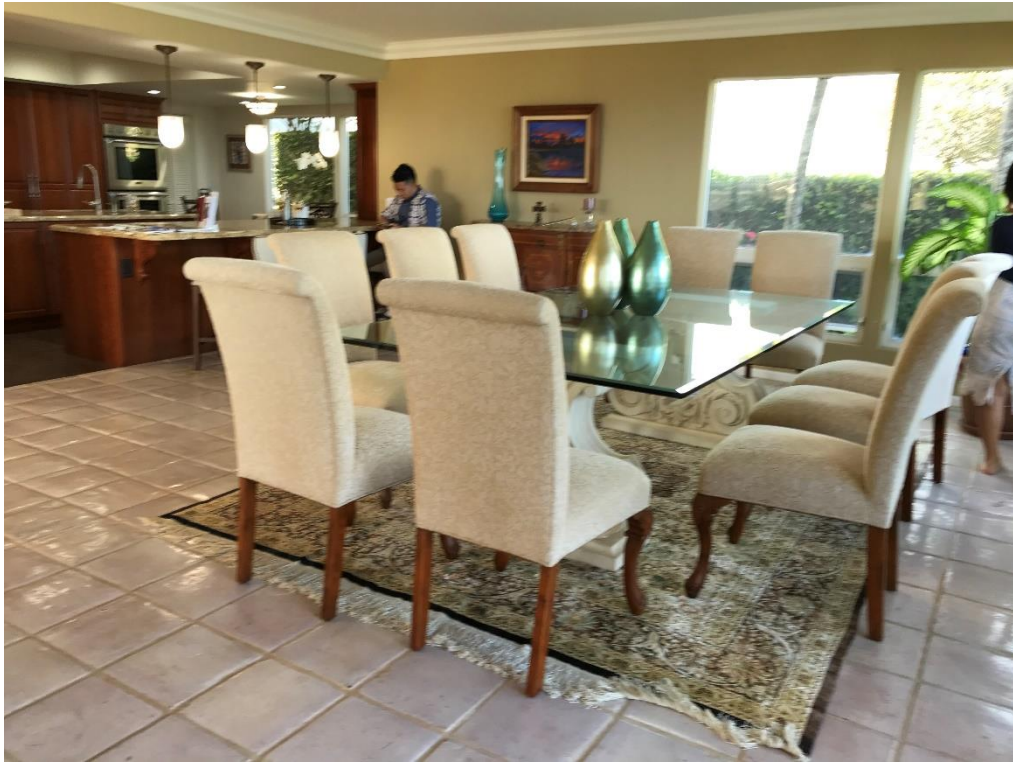
ダイニングテーブル