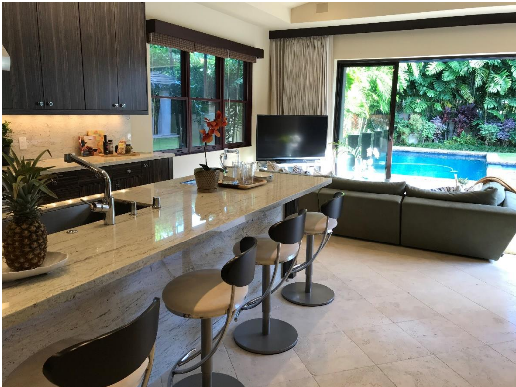
キッチンカウンター