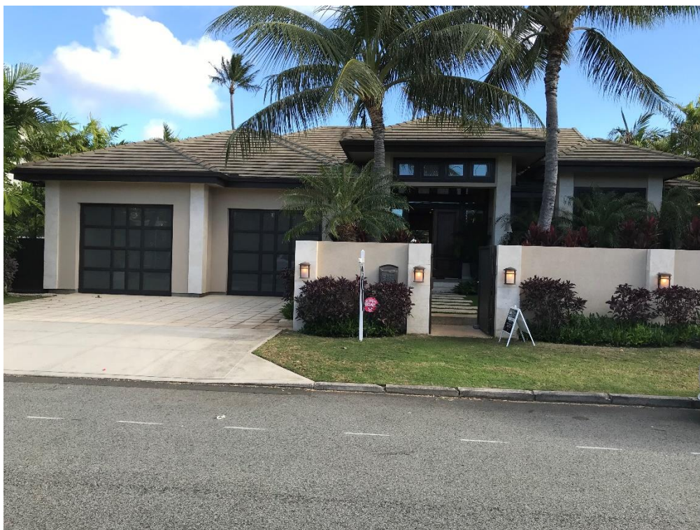
前面道路からのビュー

IV・カハラの戸建物件 敷地面積：11250 sqft 延べ床面積：4820 sqft $4,495,000 (約4億9,450万円) 2012年築 5LDK+5.5baths