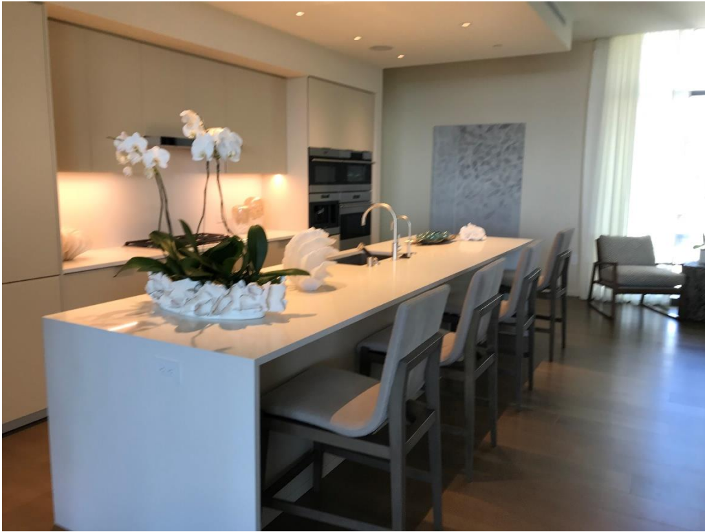
キッチンカウンター