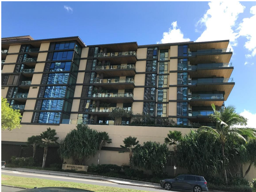
パークレイン全景