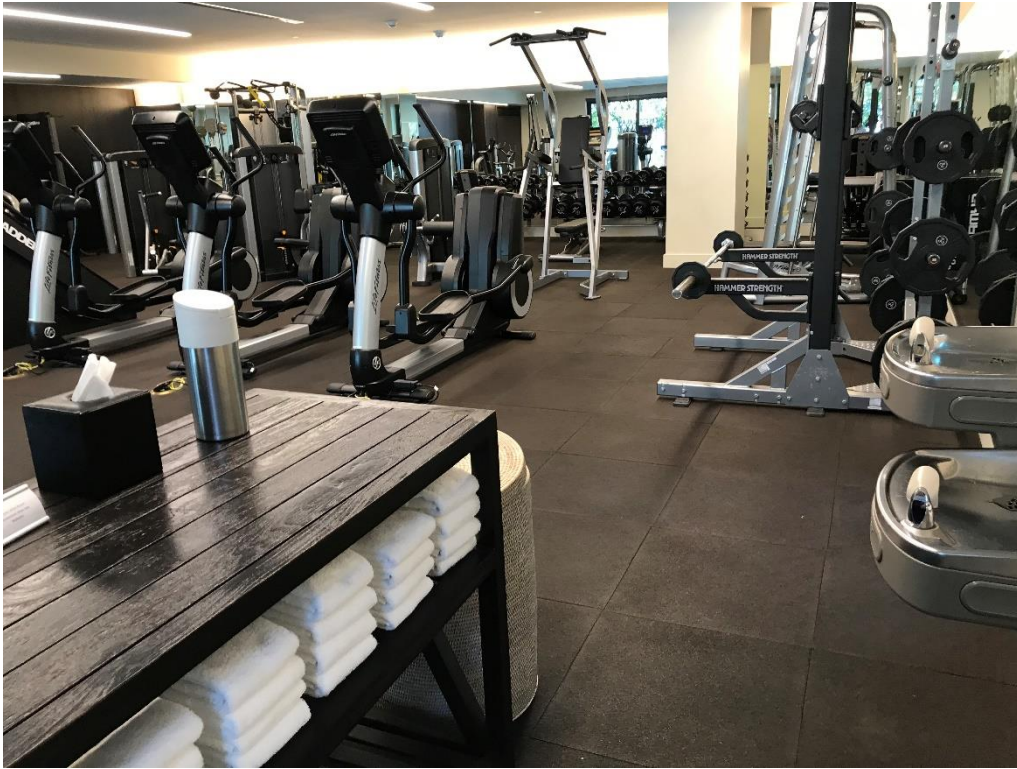
フィットネスジム