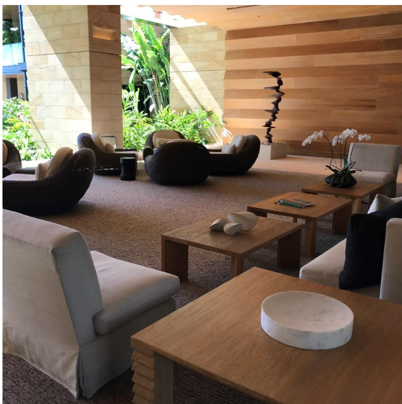
フロント（受付）エリア