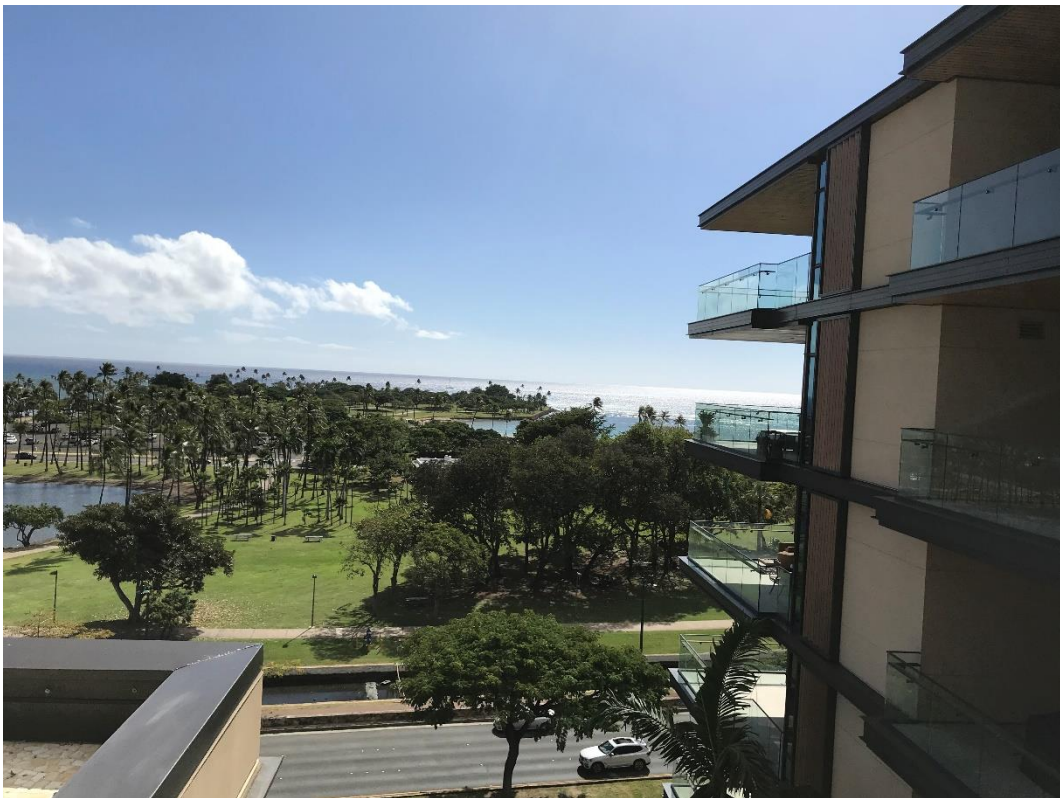
公園の向うに海を眺める